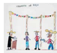
Eveline Dornelles Nunes 10 anos Tema: Festa Junina