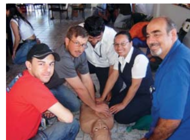
Colaboradores participam de treinamento

O grupo é formado por 28 colaboradores das unidades de Canoas, Esteio e Porto Alegre (Zona Norte, Sede Administrativa e Central de Especialidades), que receberam treinamento especializado. O objetivo é manter uma equipe organizada e capacitada para atuar na prevenção, evacuação e combate a princípios de incêndio, além da prestação de primeiros socorros.