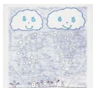
Nadyne Vieira Bueno 11 anos Tema: Inverno