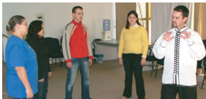
Dia 06 de junho o tema apresentado foi Tai chi chuan.