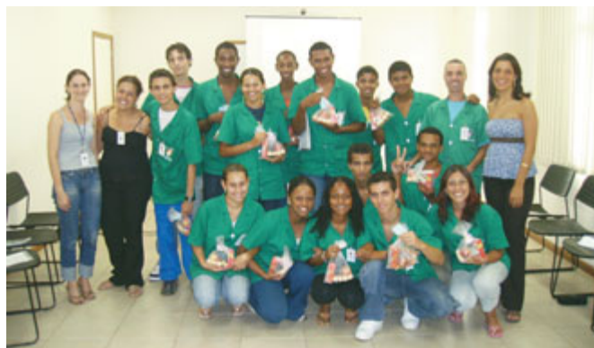
Digicon tem 15 alunos do Projeto Pescar.